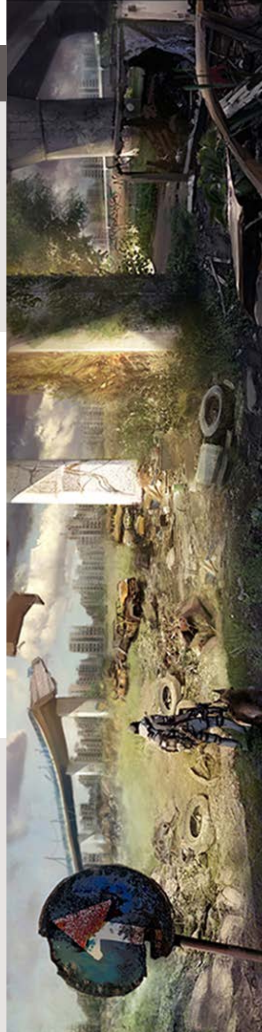
Ilustración: Noelia Alcaraz Diseño: Arteneo

Nota: Arteneo se reserva el derecho de variar contenidos y temarios si lo considerase necesario para la mejora de los mismos. El orden de materias y/o software es orientativo. El/la alum@ puede desistir de comenzar el curso informando por escrito y tendrá derecho a la devolución íntegra de lo abonado siempre que lo haga como mínimo con quince días hábiles de antelación a la fecha de comienzo del curso.