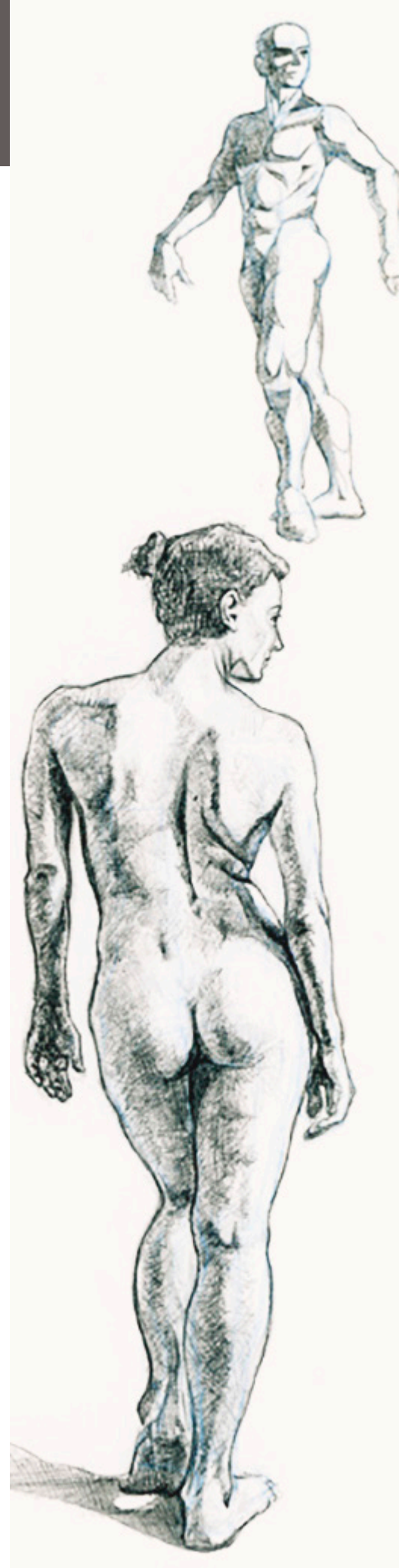
Ilustración Profesor: Alex Lachhein. Diseño: Arteneo

Nota: Arteneo se reserva el derecho de variar contenidos y temarios si lo considerase necesario para la mejora de los mismos. El orden de materias y/o software es orientativo. El/la alumx puede desistir de comenzar el curso informando por escrito y tendrá derecho a la devolución íntegra de lo abonado siempre que lo haga como mínimo con quince días hábiles de antelación a la fecha de comienzo del curso. Se consideran días hábiles, los no festivos de lunes a viernes.