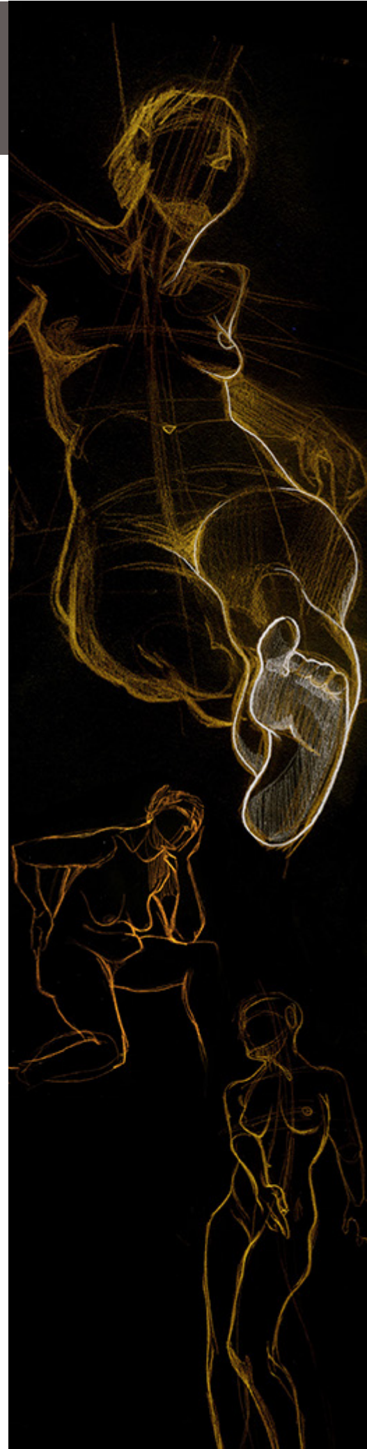
Ilustración: Beatriz Rodríguez. Diseño: Arteneo

Nota: Arteneo se reserva el derecho de variar contenidos y temarios si lo considerase necesario para la mejora de los mismos. El orden de materias y/o software es orientativo. El/la alumn@ puede desistir de comenzar el curso informando por escrito y tendrá derecho a la devolución íntegra de lo abonado siempre que lo haga como mínimo con quince días hábiles de antelación a la fecha de comienzo del curso.