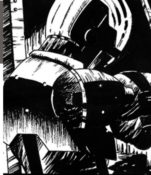
Ilustración: Juanjo Rojo. Diseño: Arteneo

Nota: Arteneo se reserva el derecho de variar contenidos y temarios si lo considerase necesario para la mejora de los mismos. El orden de materias y/o software es orientativo. El/la alumn@ puede desistir de comenzar el curso informando por escrito y tendrá derecho a la devolución íntegra de lo abonado siempre que lo haga como mínimo con quince días hábiles de antelación a la fecha de comienzo del curso.